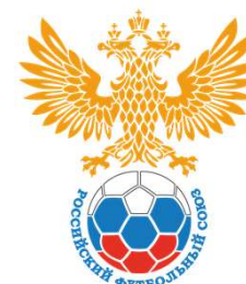
Российский футбольный союз