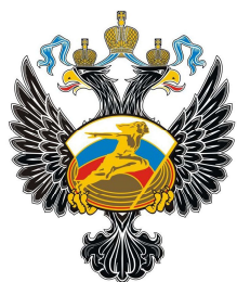
Министерство спорта РФ